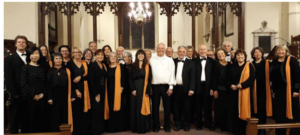
Notre dernier concert en Angleterre - Novembre 2023

* Professeur au Conservatoire de Musique de Grasse