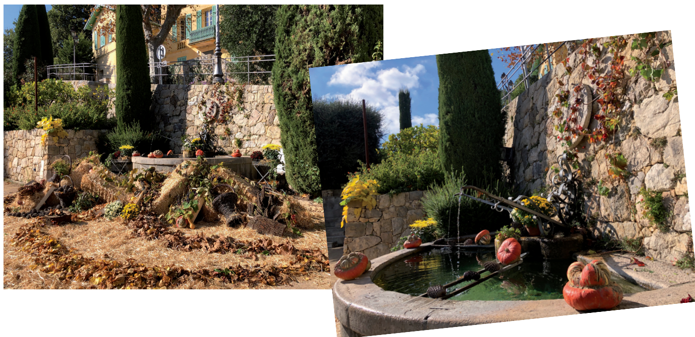
Installation éphémère d'une décoration aux couleurs de l'automne sur le square Seytre