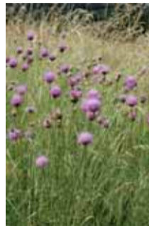
Serratula lycophilolia (P.N.R.)