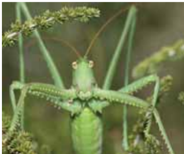
Saga pedo (orthoptère - P.N.R.)