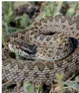
Vipera ursinii (P.N.R.)